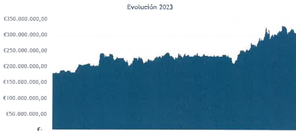
Evolución capitalización bursátil 01-01-23 a 31-12-23

Desde la óptica de los mercados financieros en general y del BME Growth en particular, el resultado obtenido por Altia en 2023 puede considerarse muy meritorio dado el entorno de alta volatilidad e incertidumbre que ha caracterizado el año en los mercados de valores. Los resultados obtenidos consolidan a Altia como una de las compañías de BME con mayor tamaño y mejor desempeño y se espera que continúe con la trayectoria de éxito iniciada en 2010, si bien -como es lógico- el entorno macroeconómico del comienzo de 2024 supone una incertidumbre para cualquier previsión que se pueda hacer.